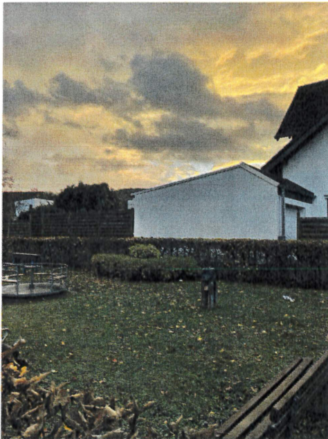
Spielplatz im Kleinflur