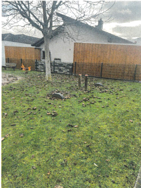
Spielplatz im Niederflur