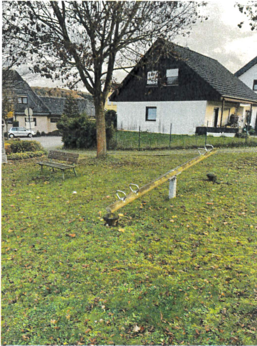
Spielplatz, am Schallmerich „S-Bahn“